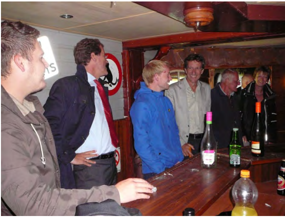
Een kijkje in "de Keet"