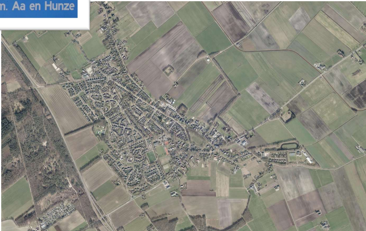
Annen van boven, 2019